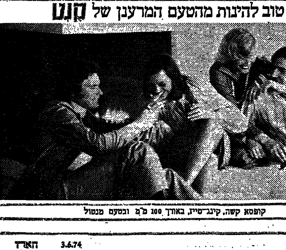
קופסת קשה קינרטי באורך 100 מ'ג ובטעם מנוול